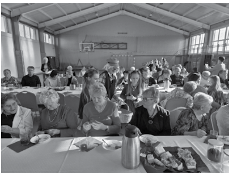
Dzieci przekazały wszystkim przybyłym drobne upominki w postaci okolicznościowych magnesów