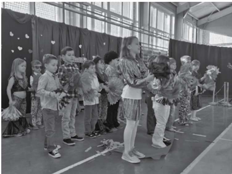
Przedstawienie artystyczne, będące wspólnym dziełem społeczności Publicznego Gminnego Przedszkola w Krzyżanowie