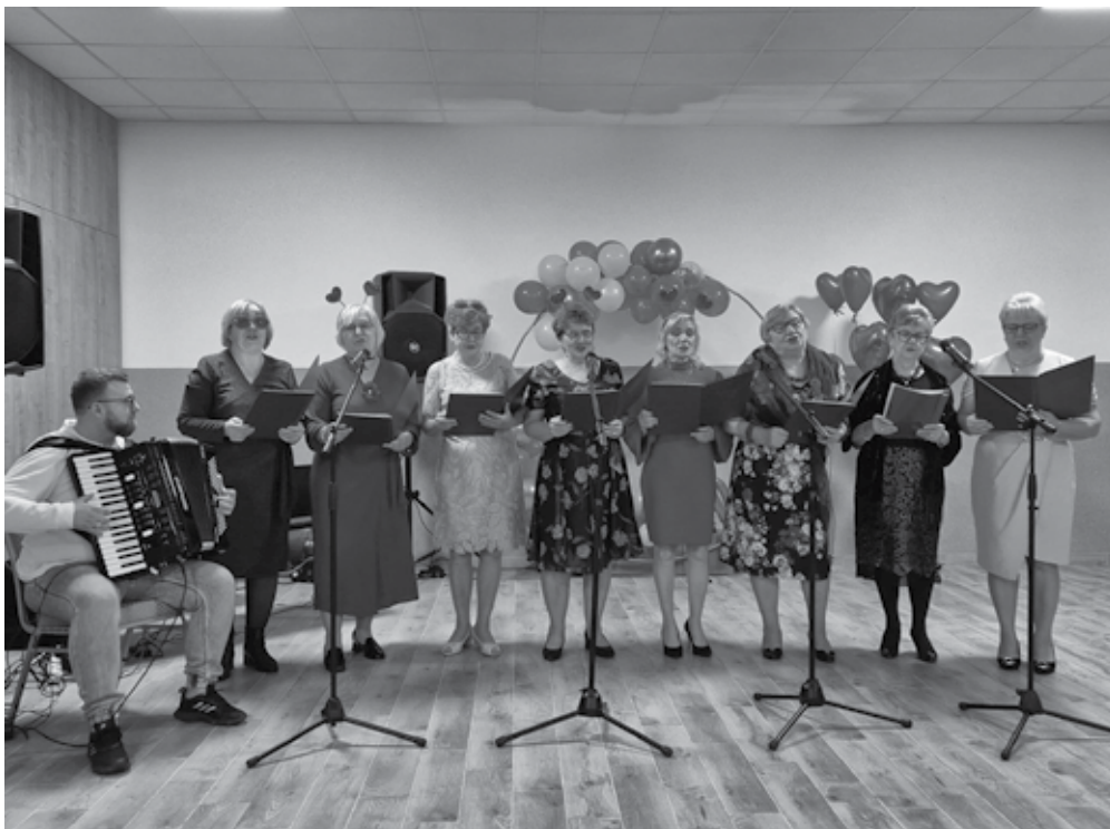
Członkinie Zespołu Śpiewaczego „Rustowianki” wyglądały i brzmiały wspaniale