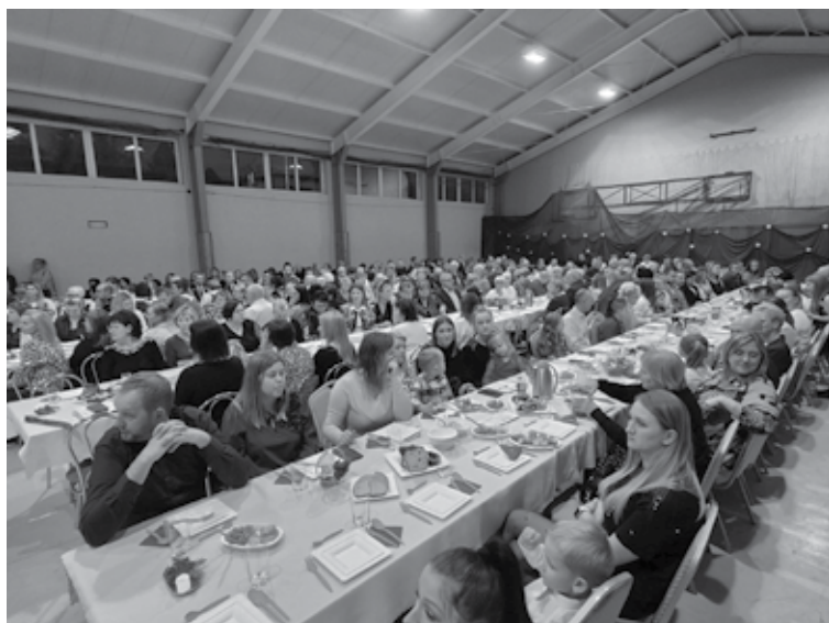
Tradycyjne spotkanie wigilijne dla mieszkańców Gminy zostało zorganizowane w hali sportowej Szkoły Podstawowej im. Kornela Makuszyńskiego w Krzyżanowie