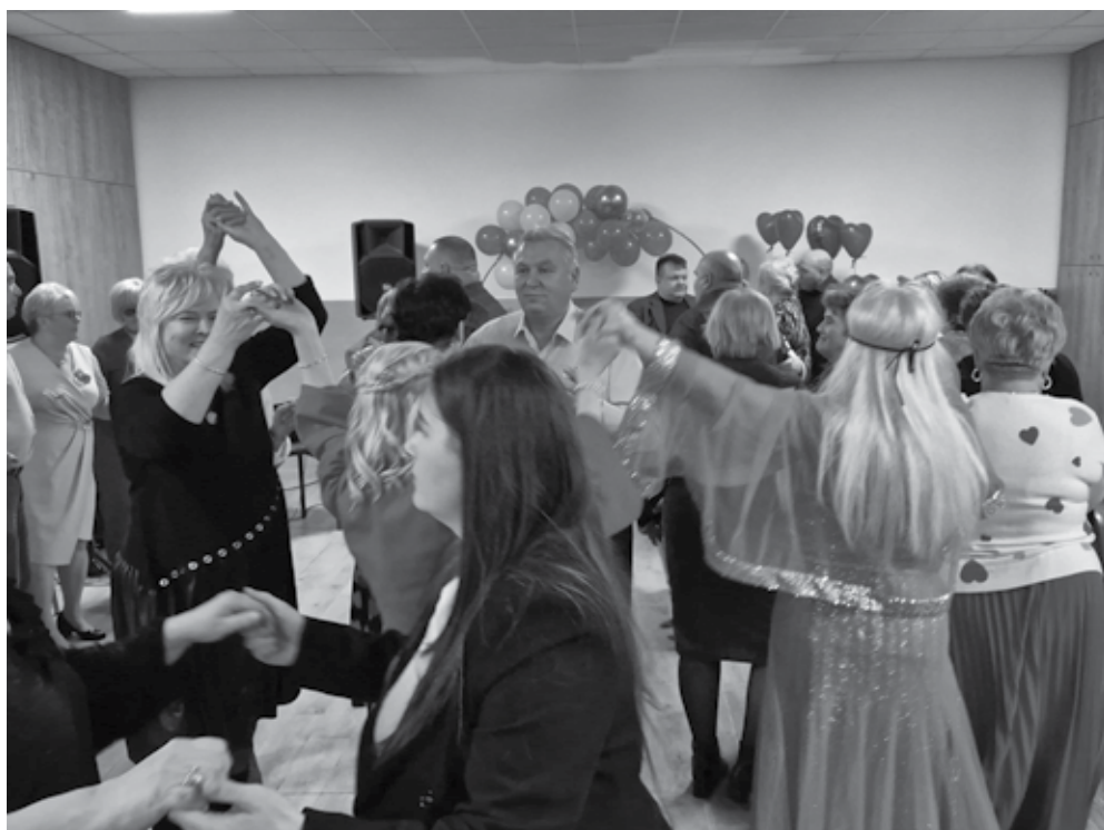
Znakomita zabawa na parkiecie podczas potańcówki