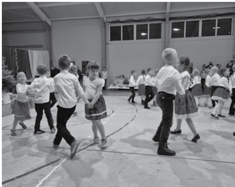
Przedszkolna grupa należąca do Zespołu Pieśni i Tańca „Kalina”...