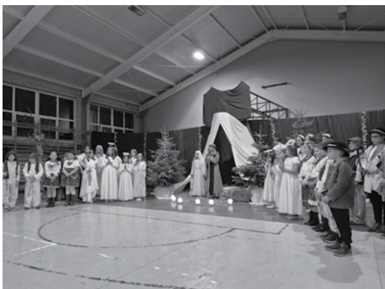
Nie zabrakło artystycznych wruszeń przy Jasełkach przygotowanych przez społeczność Szkoły Podstawowej im. Kornela Makuszyńskiego w Krzyżanowie