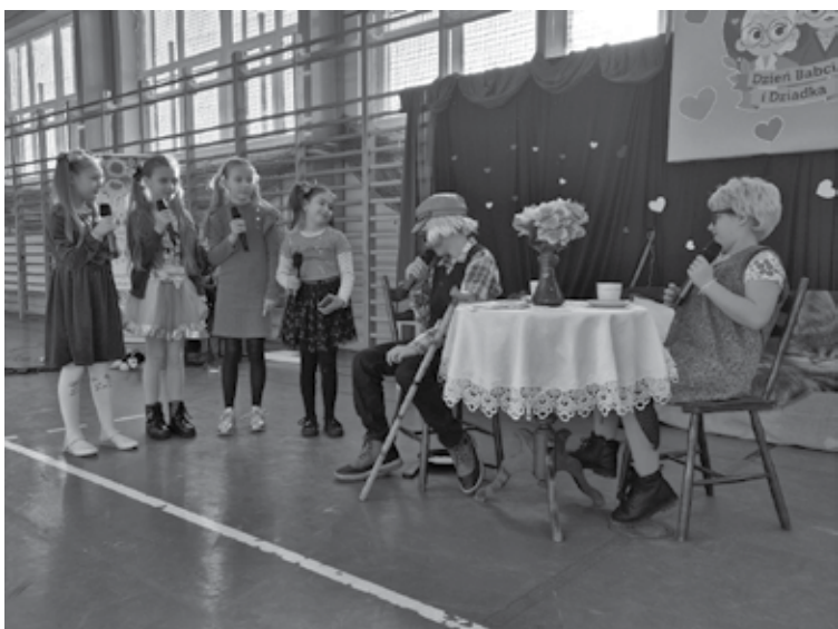
„Mała Grupa Artystyczna” z GOKiS odkryła z „przymrużeniem oka” zagadki dotyczące życia Seniorów