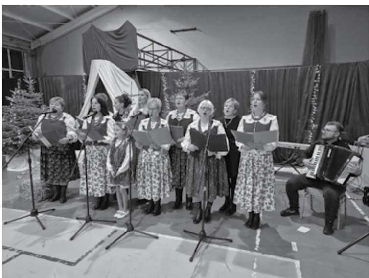
Na żadnej Wigilii nie może zabraknąć kolęd...te w ludowym wydaniu brzmią najpiękniej – Zespół Śpiewaczy „Siemienice”